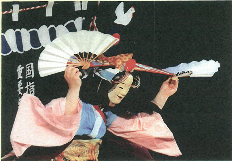
(写真 花巻市 重要無形民俗文化財 早池峰神楽)