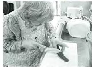
自己承認欲求を満たす