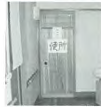
自己遂行しやすい環境設定