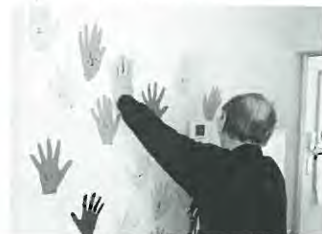
各種療法などの紹介