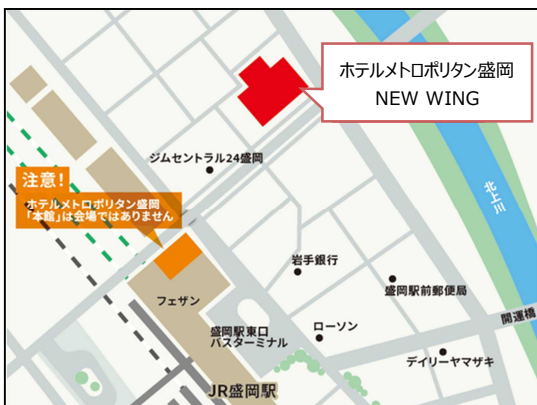
【アクセス】JR盛岡駅北口 徒歩 3分