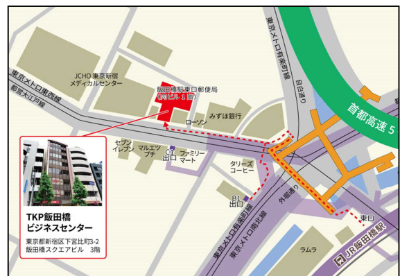
【アクセス】JR総武線 飯田橋駅 東口 徒歩 3分