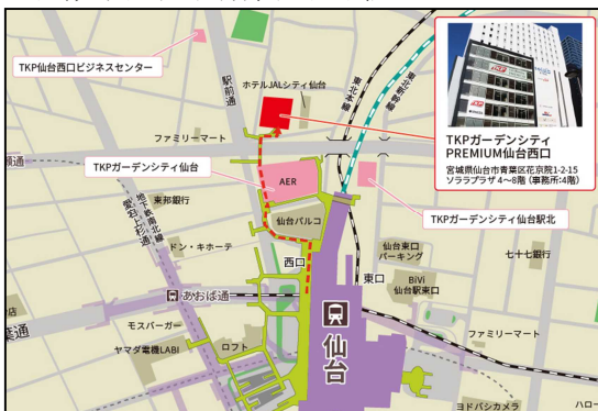
【アクセス】JR東北本線 仙台駅 西口 徒歩 3分